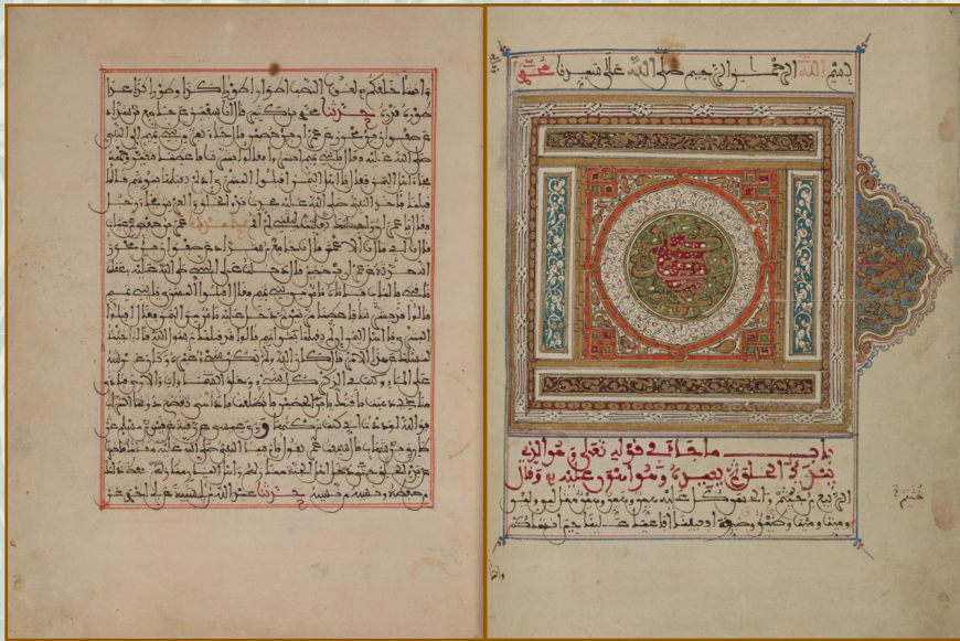
Imam Bukhari's collection of hadith - "Sahih al-Bukhari"